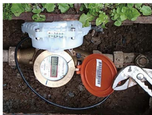
澎湖前瞻基礎建設計畫